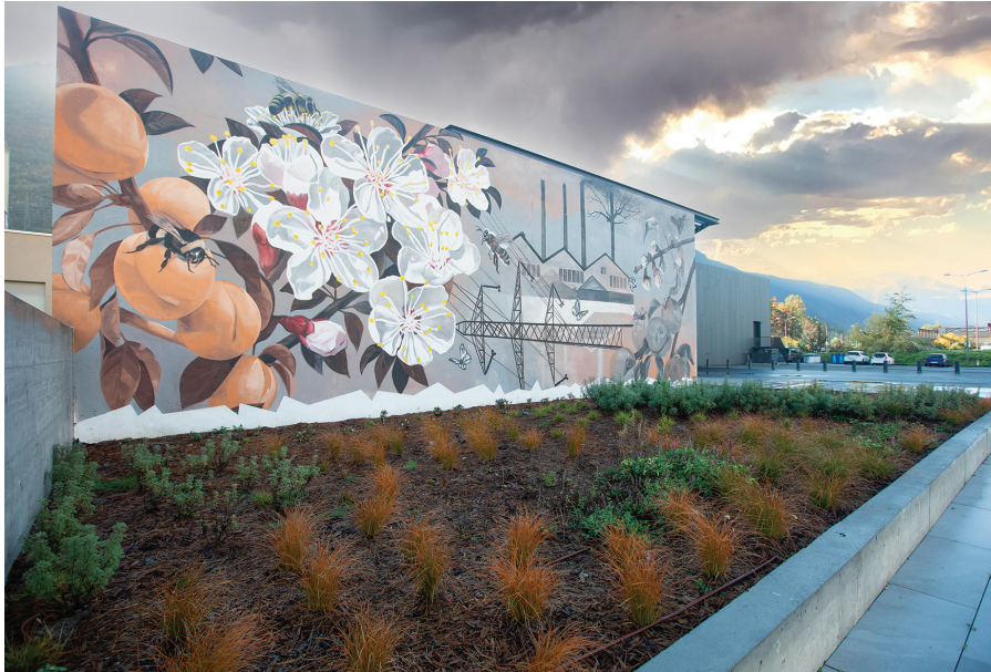
Dans les 15 ans à venir, la Commune va radicalement changer le visage de Gottfrey

Le 31 août, la Commune de Saxon présentait son projet de réaménagement du centre du village. Près de 250 personnes sont venues le découvrir.