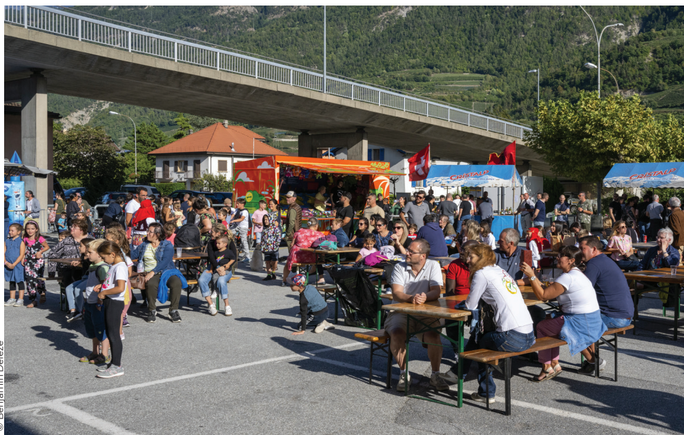
Le 10 septembre, la population était invitée à la Fête de la convivialité. Un grand succès !